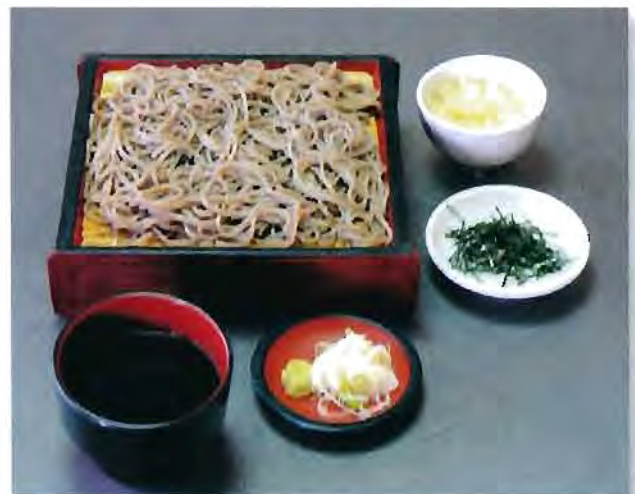
ざるそば 650円 (税込)