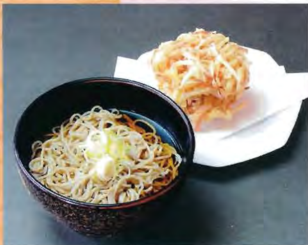
かき揚げそば 800円 (税込)