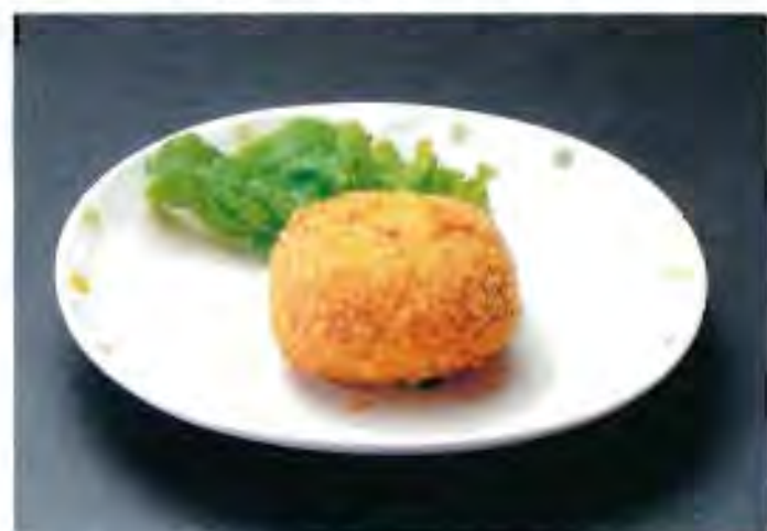
和牛煮込みコロッケ 230円 (税込)