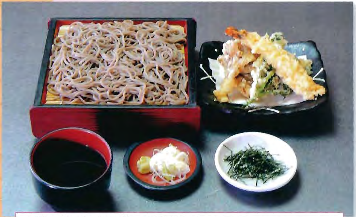
天ざるそば (天ぷら4品) 1,080円 (税込)