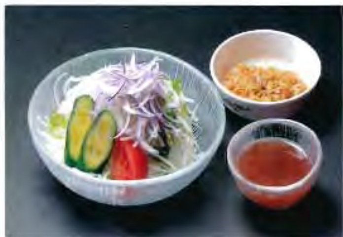
大根サラダ (梅ドレッシング) 450円 (税込)