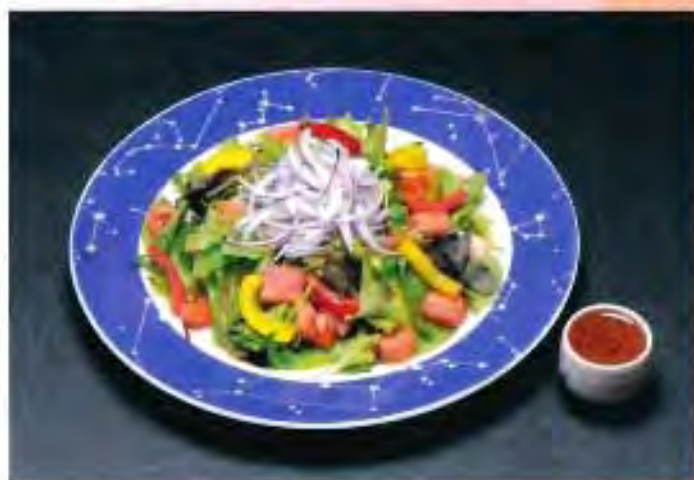
ハーブ入サラダ (イタリアンドレッシング) 500円 (税込)