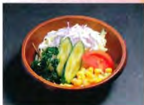
ミニサラダ (フレンチドレッシング) 280円 (税込)