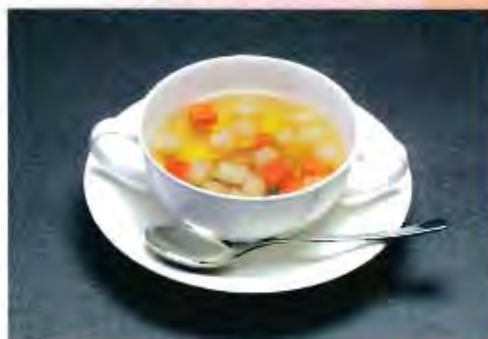
季節野菜のコラーゲンスープ 280円 (税込)