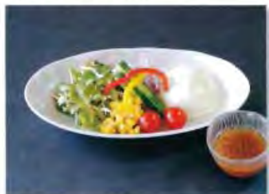
豆腐サラダ (和風ドレッシング) 650円 (税込)